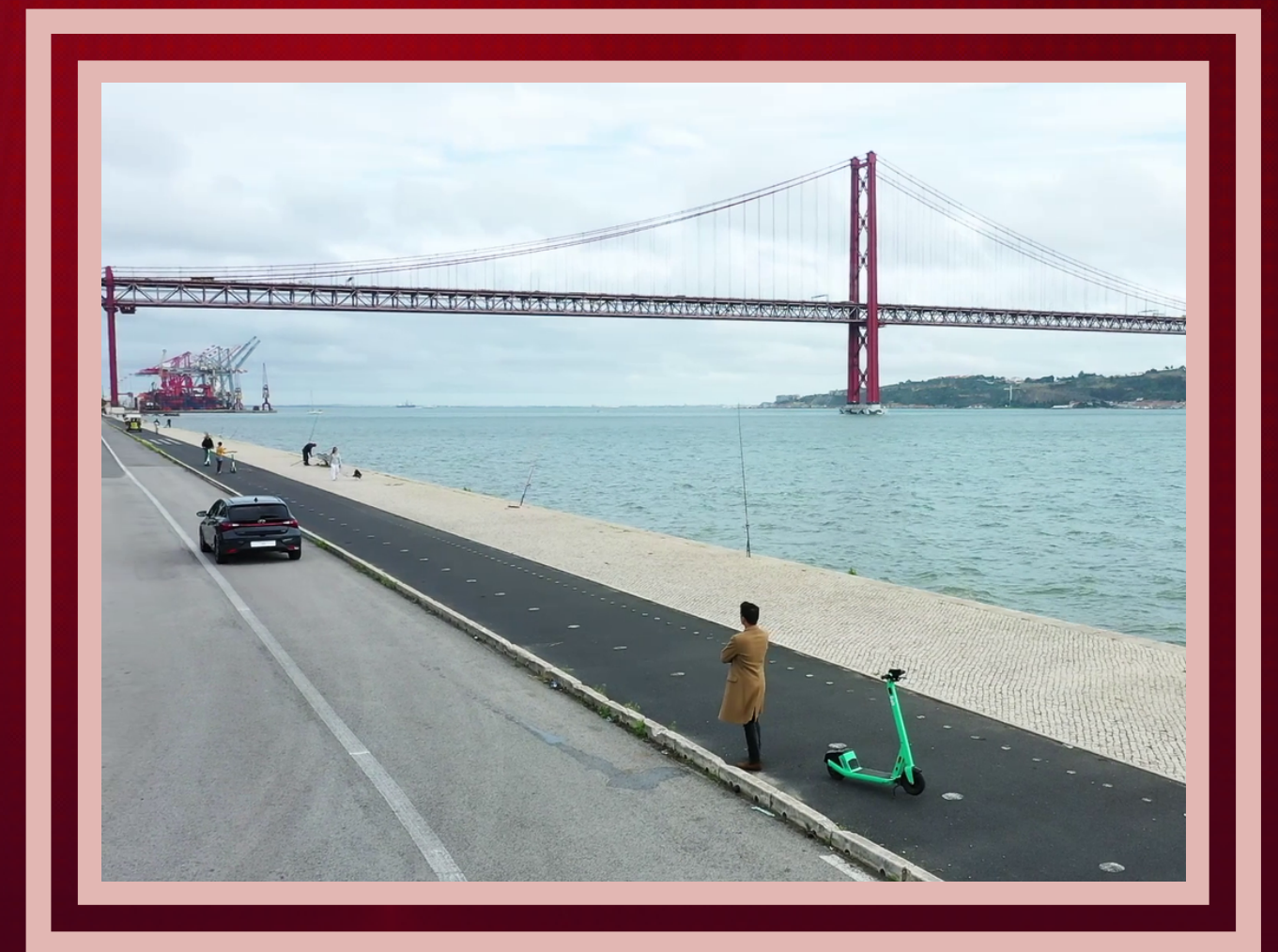
EXEMPLO (clique na imagem)