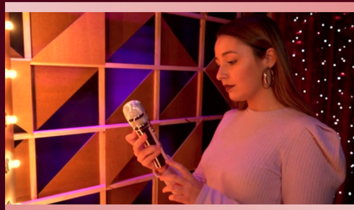
EXEMPLO (clique na imagem)