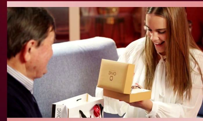
EXEMPLO (clique na imagem)

Investimento: 8.000€ (inclui 4.000€ de produção).